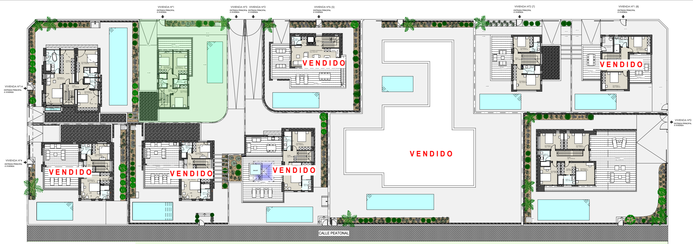
Planta primera. Conjunto